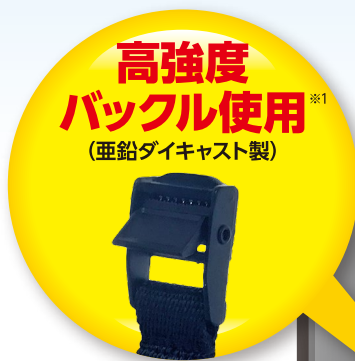
※1 当社従来製品に比べ