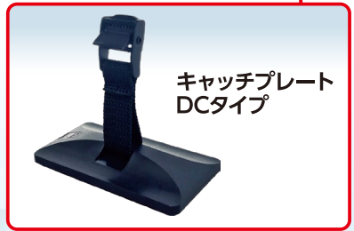
キャッチプレート DCタイプ